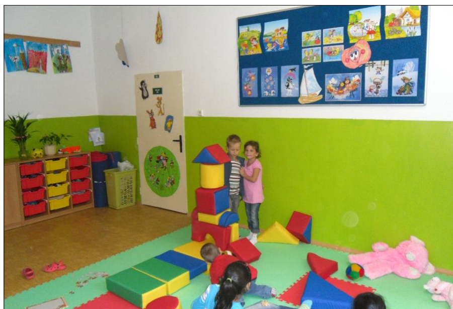
Budoucí školáci si hrají

Děti se zde cítí útulně, mají tu plno hraček, nové skříňky, stolky se židlemi a koberec, na kterém ráno se-